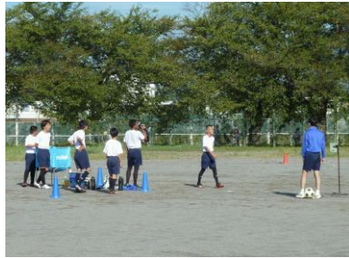
朝練習がなんと半年ぶり！に再開されました。新人戦に向けて頑張れ！