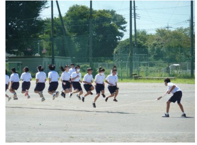
大縄跳びは、今年は少しでも密を防ぐため少人数で跳びます。