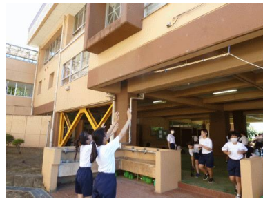
ミストシャワーを暑さ対策として設置しました。自由にどうぞ。