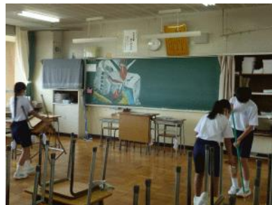
集中して無言清掃に取り組むこのクラスはどこでしょうか。素晴らしい！