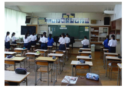
音楽の授業は、クラスが3つの教室に分かれマスク着用で行います。