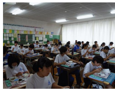
素早い準備、そしてかなり静かな食事風景。改めて「えらいなあ」と感心。