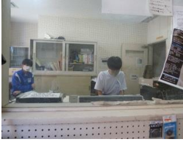
放送による始業式。代表生徒のあいさつ、すごく上手でした！