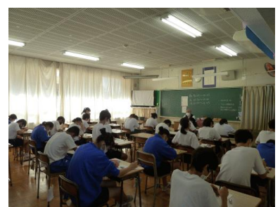
4市テスト（3年生）。進路選択や苦手箇所克服に役立てよう。