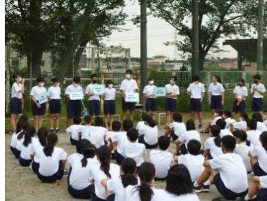
体育祭の結団式。団長を中心に力強い優勝宣言がされました。